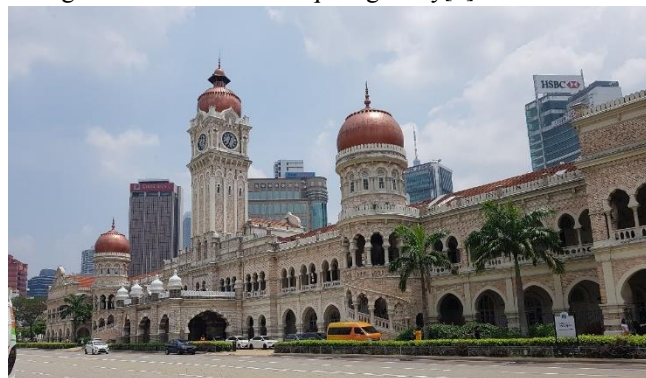
Hình 2 Tòa nhà dinh toàn quyền Anh ở quảng trường Merdeka, Kuala Lumpur

Ngược dòng lịch sử, sự thuận lợi về hàng hải và vị trí địa lý chiến lược đã có những ảnh hưởng mạnh mẽ, xuyên suốt đối với lịch sử hình thành của Malaysia. Văn hóa Ấn Độ giáo, Phật giáo và Hồi giáo theo con đường giao thương đã đặt ảnh hưởng đến quốc gia này từ rất sớm. Hồi giáo đến Malaysia ngay từ thế kỷ thứ 10, thiết lập nền tảng vững chắc ở thế kỷ thứ 14 và 15, kéo theo việc thành lập một loạt các vương quốc Hồi giáo, nổi bật nhất là Malacca. Đến nay, Hồi giáo đã trở thành quốc giáo của liên bang Malaysia và ảnh hưởng sâu rộng đến mọi mặt của đời sống người dân. Ngoài ra, trong chiều dài lịch sử của mình, việc từng là thuộc địa của Bồ Đào Nha, Hà Lan, Anh cũng ảnh hưởng không nhỏ đến văn hóa của quốc gia này[1].