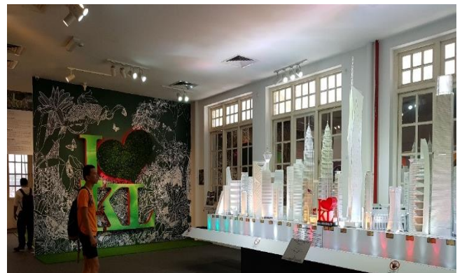
Hình 8 Mô hình các công trình cao tầng đã và đang xây dựng được trưng bày ở Nhà trưng bày thành phố.

Ở Kuala Lumpur, mọi dự án xây mới đều được minh bạch và triển lãm ở Phòng trưng bày của thành phố. Sự lắng nghe của chính quyền đối với ý kiến của người dân và các chuyên gia đã làm cho các công trình cao tầng xây dựng sau này ở Kuala Lumpur đều thống nhất về tư tưởng và không phá vỡ không gian đô thị cũ.