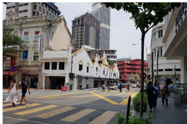
Hình 3 Đường phố quanh khu chợ trung tâm Kuala Lumpur

Có thể nói, nền văn hóa của Kuala Lumpur là sự tổng hợp và pha trộn giữa những nền văn hóa khác nhau du nhập vào (Ấn Độ, Trung Hoa, Hồi giáo, phương Tây) và người Mã Lai bản địa. Ở những nơi khác trên thế giới, việc có quá nhiều các phong cách và văn hóa khác nhau sẽ gây bất lợi cho việc quản lí của chính quyền và khó tạo nên sự đồng nhất về qui hoạch và kiến trúc cho địa phương đó. Nếu quản lí và định hướng không khéo có thể dẫn đến sự xung đột và bất ổn trong đời sống xã hội. Đây là một thách thức không nhỏ trong bài toán phát triển đối với bất cứ quốc gia nào. Tuy nhiên, ở Malaysia, các tôn giáo và văn hóa khác nhau kể trên vẫn được tôn trọng và tồn tại song song chung với quốc giáo là Hồi giáo. Nhiều nền văn hóa cộng hưởng dẫn đến các công trình kiến trúc có hình thái rất phong phú và đa dạng. Chính phủ Malaysia với những chính sách của mình đã giữ cho sự đa dạng văn hóa và kiến trúc này trở thành đặc trưng văn hóa của họ.